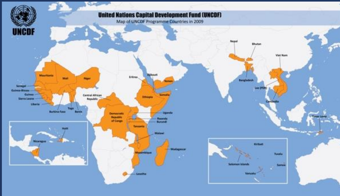
Rysunek 1. Wykaz krajów najłagodniej rozwiniętych (LDCs) wg ONZ